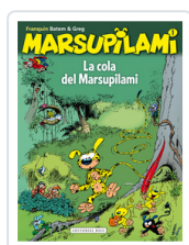
MARSUPILAMI, 1 LA COLA FRANQUIN, ANDRE