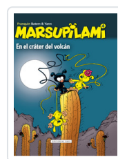
MARSUPILAMI, 4 EN EL CRATER VOLCAN FRANQUIN, ANDRE