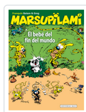
MARSUPILAMI, 2 BEBE FIN FRANQUIN, ANDRE