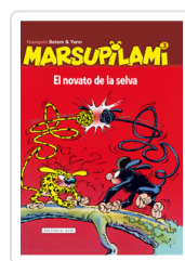
MARSUPILAMI, 3 NOVATO DE LA SELVA FRANQUIN, ANDRE