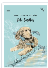
POR TI PASA EL RÍO CASILLAS, VIOLE