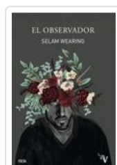
OBSERVADOR, EL WEARING, SELAM