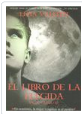
SAGA VANIR, 3 LIBRO ELEGIDA VALENTI, LENA