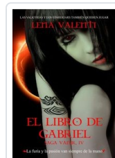
SAGA VANIR, 4 LIBRO GABRIEL VALENTI, LENA