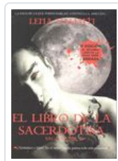
SAGA VANIR, 2 LIBRO SACERDOTISA VALENTI, LENA