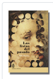
LISTAS DEL PASADO, LAS HAYDEN, JULIE