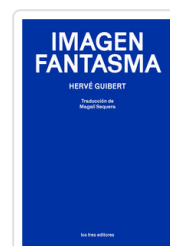
IMAGEN FANTASMA GUBERT, HERVE