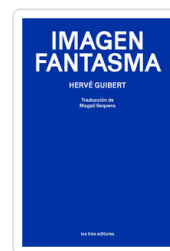
IMAGEN FANTASMA GUBERT, HERVE