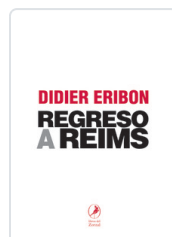
REGRESO A REIMS ERIBON, DIDIER