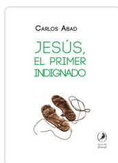
JESUS EL PRIMER INDIIGNADO ABAD, CARLOS