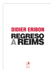
REGRESO A REIMS ERIBON, DIDIER