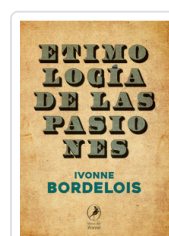
ETIMOLOGIA DE LAS PASIONES BORDELOIS, IVONNE