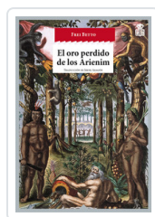
ORO PERDIDO DE LOS ARIENIM, EL BETTO, FREI