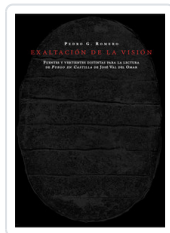
EXALTACION DE LA VISION ROMERO, PEDRO