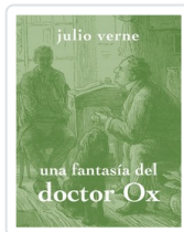
UNA FANTASIA DEL DOCTOR OX VERNE, JULIO