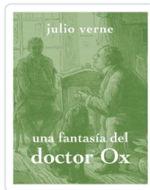
UNA FANTASIA DEL DOCTOR OX VERNE, JULIO