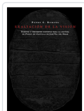
EXALTACION DE LA VISION ROMERO, PEDRO