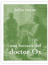
UNA FANTASIA DEL DOCTOR OX VERNE, JULIO