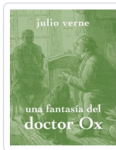
UNA FANTASIA DEL DOCTOR OX VERNE, JULIO