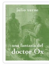
UNA FANTASIA DEL DOCTOR OX VERNE, JULIO