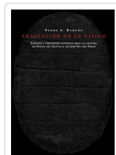
EXALTACION DE LA VISION ROMERO, PEDRO