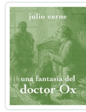
UNA FANTASIA DEL DOCTOR OX VERNE, JULIO