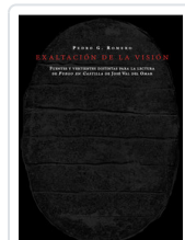
EXALTACION DE LA VISION ROMERO, PEDRO