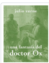
UNA FANTASIA DEL DOCTOR OX VERNE, JULIO