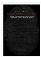
EXALTACION DE LA VISION ROMERO, PEDRO