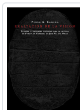
EXALTACION DE LA VISION ROMERO, PEDRO