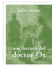
UNA FANTASIA DEL DOCTOR OX VERNE, JULIO