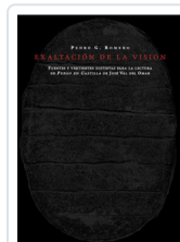
EXALTACION DE LA VISION ROMERO, PEDRO