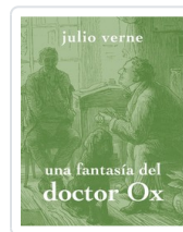
UNA FANTASIA DEL DOCTOR OX VERNE, JULIO