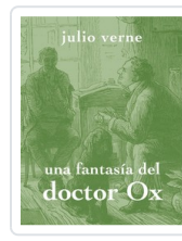
UNA FANTASIA DEL DOCTOR OX VERNE, JULIO