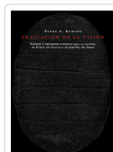
EXALTACION DE LA VISION ROMERO, PEDRO