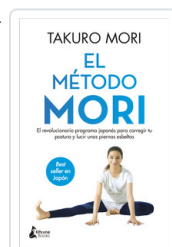
METODO MORI, EL MORI, TAKURO