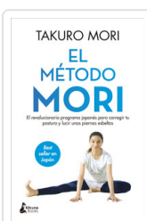
METODO MORI, EL MORI, TAKURO