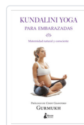
KUNDALINI YOGA PARA EMBARAZADAS GURMUKH