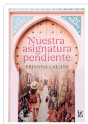
NUESTRA ASIGNATURA PENDIENTE CALLUM, BRIANNA