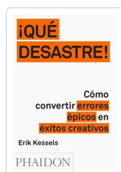
QUE DESASTRE AA.VV.