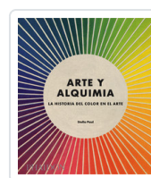
ARTE Y ALQUIMIA PAUL, STELLA