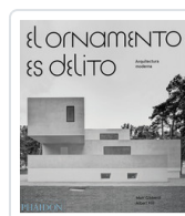
ORNAMENTO ES DELITO, EL GIBBERD/ HILL