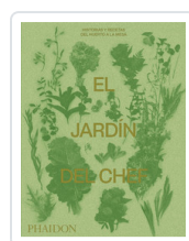
JARDIN DEL CHEF PHAIDON EDITORS