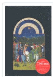
HISTORIA DEL ARTE 16 - ED. E.H.GOMBRICH (T) GOMBRICH, E.H.