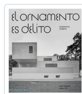
ORNAMENTO ES DELITO, EL GIBBERD/ HILL