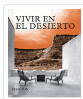
VIVIR EN EL DESIERTO PHAIDON