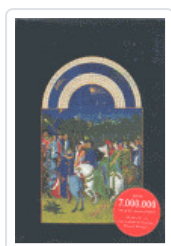
HISTORIA DEL ARTE 16 - ED. E.H.GOMBRICH (T) GOMBRICH, E.H.