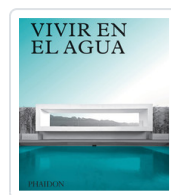
VIVIR EN EL AGUA PHAIDON