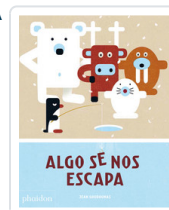
ALGO SE NOS ESCAPA SOMETHING'S FISHY