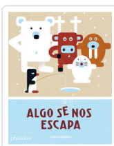
ALGO SE NOS ESCAPA SOMETHING'S FISHY