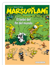
MARSUPILAMI, 2 BEBE FIN FRANQUIN, ANDRE