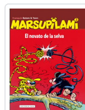
MARSUPILAMI, 3 NOVATO DE LA SELVA FRANQUIN, ANDRE