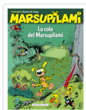
MARSUPILAMI, 1 LA COLA FRANQUIN, ANDRE