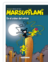
MARSUPILAMI, 4 EN EL CRATER VOLCAN FRANQUIN, ANDRE