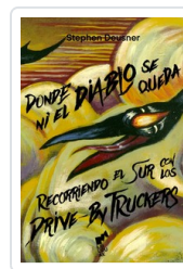
DONDE NI EL DIABLO SE QUEDA. RECORRIENDO EL SUR CON DRIVE-B DEUSNER, STEPHEN