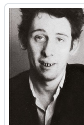
UNA FURIOSA DEVOCION. BIOGRAFIA AUTORIZADA SHANE MACGOWEN BALLS, RICHARD