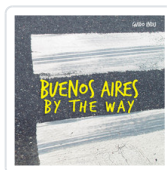
BUENOS AIRES BY THE WAY INDIJ, GUIDO