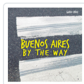
BUENOS AIRES BY THE WAY INDJU, GUIDO