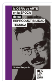
OBRA DE ARTE EN LA EPOCA, LA BENJAMIN, WALTER