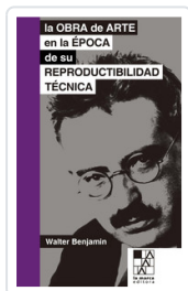
OBRA DE ARTE EN LA EPOCA, LA BENJAMIN, WALTER