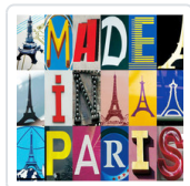
MADE IN PARIS