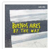
BUENOS AIRES BY THE WAY INDJU, GUIDO