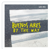
BUENOS AIRES BY THE WAY INDIJ, GUIDO