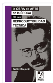
OBRA DE ARTE EN LA EPOCA, LA BENJAMIN, WALTER