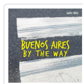
BUENOS AIRES BY THE WAY INDJ, GUIDO