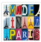
MADE IN PARIS