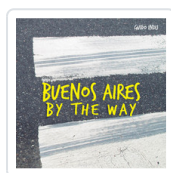
BUENOS AIRES BY THE WAY INDIJ, GUIDO