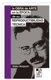
OBRA DE ARTE EN LA EPOCA, LA BENJAMIN, WALTER