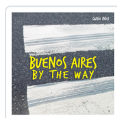
BUENOS AIRES BY THE WAY INDIJ, GUIDO