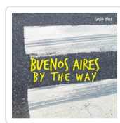
BUENOS AIRES BY THE WAY INDIJ, GUIDO