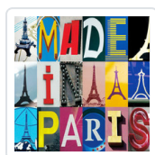
MADE IN PARIS