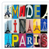
MADE IN PARIS