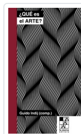
QUE ES EL ARTE INDIJ, GUIDO