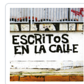
ESCRITOS EN LA CALLE GUERRI, ALEJANDRO