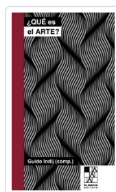
QUE ES EL ARTE INDIJ, GUIDO