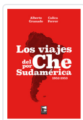
VIAJES DEL CHE POR SUDAMERICA, LOS FERRER, CALICA