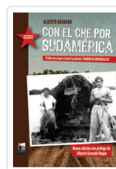
CON EL CHE POR SUDAMERICA GRANADO, ALBERTO