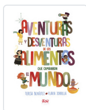
AVENTURAS Y DESVENTURAS ALIMENTOS BENEITEZ, TERESA