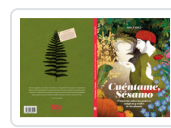
CUENTAME SESAMO MUÑIZ, JACOBO