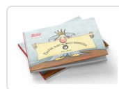
BATEK-DAKI- NONGO-ERREGA ABADI, ARIEL