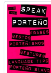
SPEAK PORTEÑO INDIJ, GUIDO