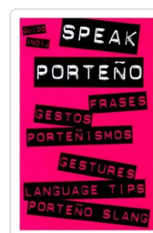
SPEAK PORTEÑO INDIJ, GUIDO