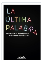
ULTIMA PALABRA, LA INDIJ, GUIDO