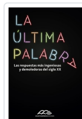
ULTIMA PALABRA, LA INDIJ, GUIDO