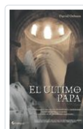
ULTIMO PAPA, EL OSBORN, DAVID