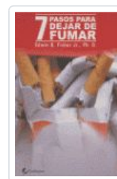
7 PASOS PARA DEJAR DE FUMAR FISHER, EDWIN