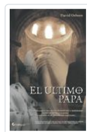
ULTIMO PAPA, EL OSBORN, DAVID