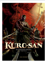
KURO-SAN, 2 EL SAMURAI NEGRO GLORIS/ ZARCONÉ