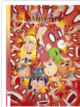
MADEMOISELLE V, 3 ENEBRAL/ MARINA