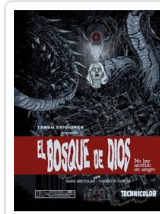
BOSQUE DE DIOS. NO HAY SACRIFICIO SIN SANGRE BERTOLINI/ RAMON